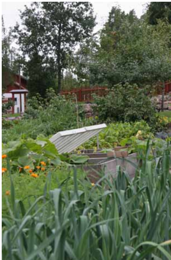
Stabergs barockträdgård utanför Falun.