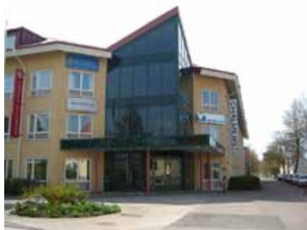
High Voltage Valley i Ludvika arbetar med att vidareutveckla och stärka regionens världsledande ställning inom elkraftsteknik.

Dalarnas forskningsråd utvärderar projektets arbete genom följeforskning. Det övergripande målet för följeforskning är att skapa förutsättningar för